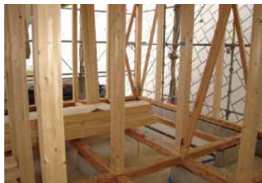
土台にアンカーボルトを打つ